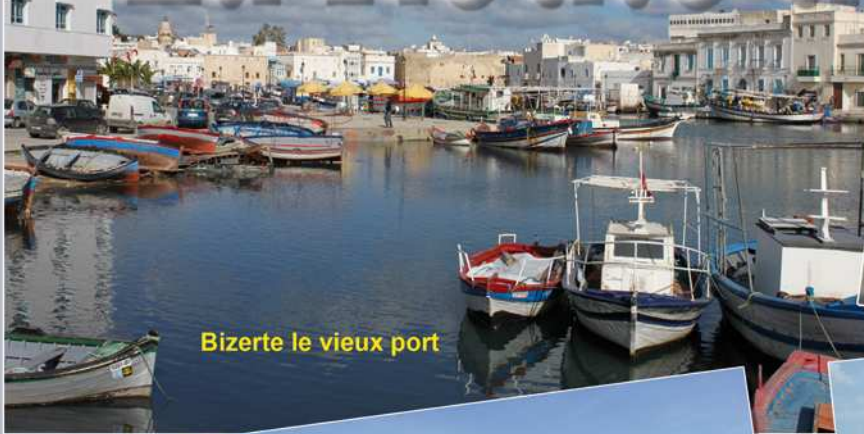
Bizerte le vieux port