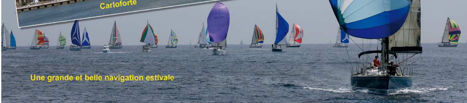
Une grande et belle navigation estivale